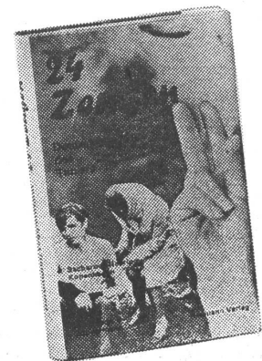
Zabel'schensky: „Während die UdSSR sich damit brüstet, ein Inbegriff der Demokratie zu sein, ist sie in Wirklichkeit nichts anderes als ein riesiges Konzentrationslager.“

Dem Gleichberechtigungsprinzip widerspricht jedoch schon Artikel 28 über das Wahlrecht, da — wie bis 1936 in der Sowjetunion und in den ersten Jahren der «Volksmacht» in Osteuropa — ein Teil der Bevölkerung des Wahlrechts offensichtlich beraubt ist: «Alle Bürger der Volksrepublik Mozambique über 18 Jahren haben das Recht zu wählen und gewählt zu werden, mit