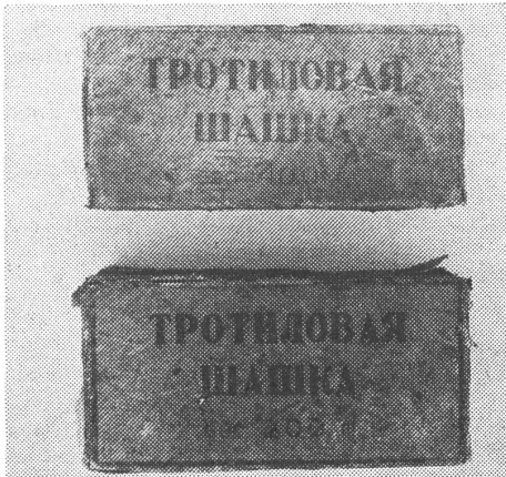
Als Friedensstaat den Krieg gegen den Imperialismus unterstützen: Sowjetische Tretnine via Mozambique nach Rhodesien.

Nach sowjetischem Muster wird zwischen persönlichem (Art. 12) und privatem Eigentum (Art. 13) unterschieden; das erste wird ohne Vorbehalt anerkannt und garantiert, das zweite den staatlichen Interessen untergeordnet. «Das Privateigentum darf nicht den Interessen schaden, die in der Verfassung verankert sind.» (Art. 13)