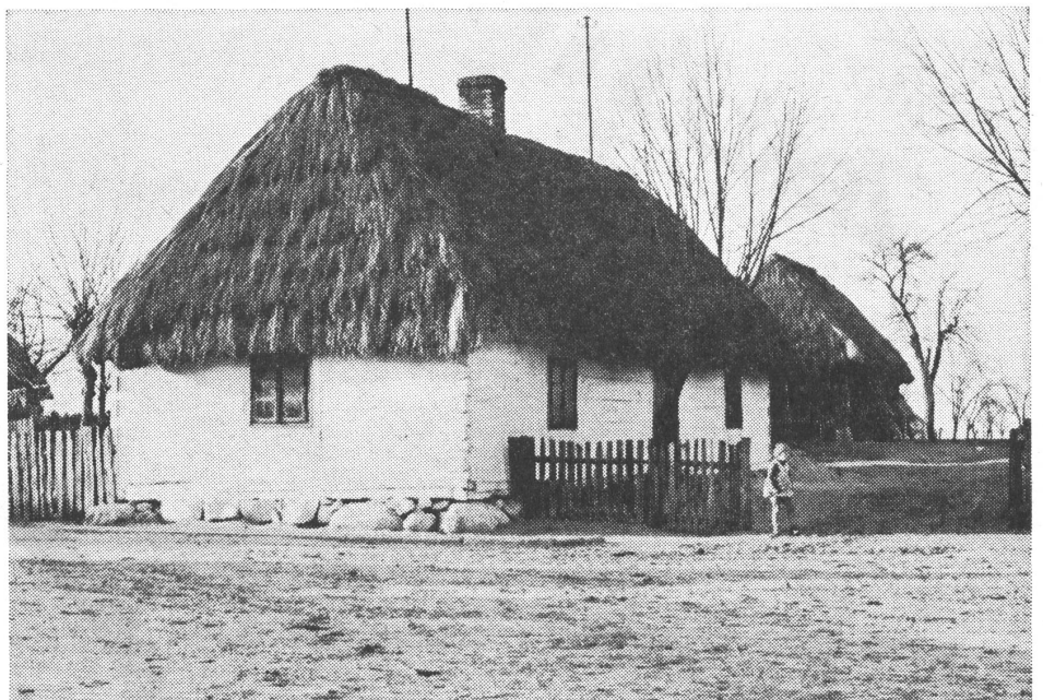
Kleinbauernhaus zwischen Breslau und Lodz.

Ein Phänomen in Polen ist der florierende Schwarzhandel. Die Währungslage ist stark zugunsten des Dollar verschoben, das heisst, der