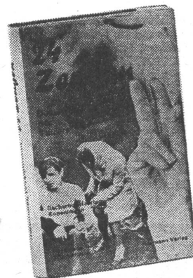
Zabelischensky: „Während die UdSSR sich damit brüstet, ein Inbegriff der Demokratie zu sein, ist sie in Wirklichkeit nichts anderes als ein riesiges Konzentrationslager.“

Die Armee bildete sogenannte Volksstreitkräfte für die Befreiung Angolas (FAPLA); bald kamen