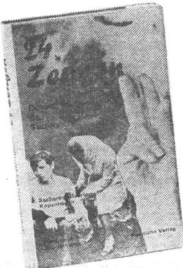
Zabelischensky: Während die UdSSR sich damit brüstet, ein Inbegriff der Demokratie zu sein, ist sie in Wirklichkeit nichts anderes als ein riesiges Konzentrationslager.*