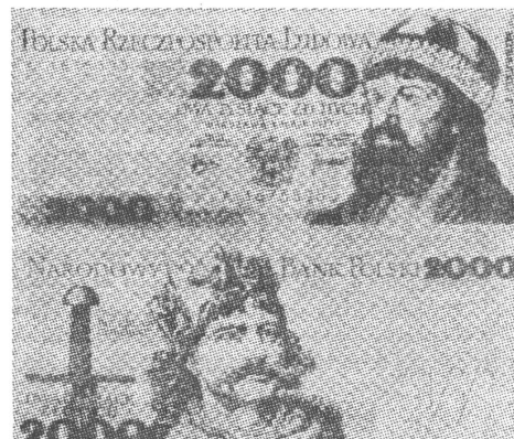
Die neue Banknote mit den alten Königen.