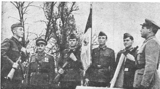
Fahneneid rumänischer Soldaten. Er wird auf eine sozialistische Heimat abgelegt, die von aussen einzig durch den «sozialistischen Internationalismus» in der Interpretation des mächtigen Nachbarn bedroht wird. Im Innern sind nicht nur die sozialistischen Gefühle je nach Rang im sozialistischen System unterschiedlich, sondern auch die heimatlichen Gefühle je nach ethnischer Zugehörigkeit.

Die drittgrösste Nationalität bilden die Zigeuner mit 229 986 Personen (1,06 Prozent der Landesbevölkerung). Unter dieser Gruppe dürfte es besonders viele Leute geben, die es vorzogen, sich im ethnischen Sinne als Rumänen auszugeben, um Benachteiligungen zu entgehen.