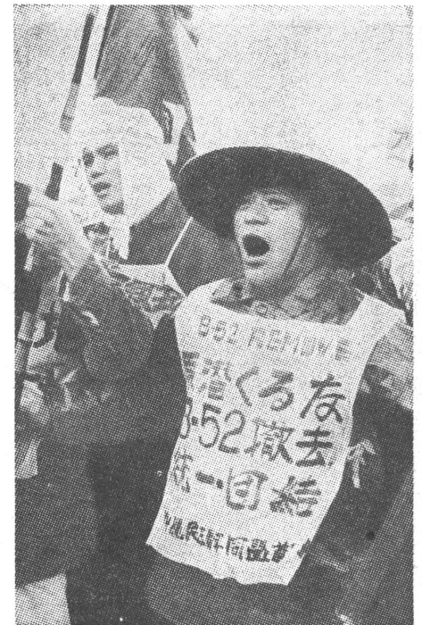
Als in sowjetischen Augen alles noch richtig war: In den sechziger Jahren protestierte man in Japan mit Erfolg gegen den amerikanischen Stützpunkt auf Okinawa, demonstrierte aber nicht gegen die sowjetische Besetzung der Kurilen.

Viel ausführlicher geht die «Prawda» auf die Geschichte der KPJ-Stellungnahmen zu dieser Frage ein. Der Nachweis eines diesbezüglichen Wandels wird so gründlich geführt, als ob die japanischen Kommunisten die Absicht hätten, ihn zu leugnen. Doch sehr bald wird man gewahr, warum den Sowjets dieses Motiv so relevant erscheint. Es geht ihnen nämlich praktisch ausschliesslich darum, dass die Territorialfrage auch richtig, d. h. parteigemäss gesehen wird. Ob man die sowjetischen Eigentumsrechte auf die Kurilen einsieht oder nicht, hängt nämlich davon ab, ob man zum Proletariat oder zur Bourgeoisie gehört: «Die KPJ-Führung hat in ihren Losungen zum 1. Mai den Aufruf gebracht, die japanischen ‚Anrechte‘ auf die Kurilen nicht aufzugeben. Und das am internationalen Tag der Arbeit!» Aber es sei gefährlich, sich so vom Marxis-