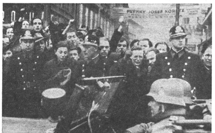
Integration durch Anschluss und Protektoratsbildung, wie 1968 beim Einmarsch in die Tschechoslowakei. Zur Aufnahme links schrieb damals «Vjesnik», Zagreb: «Ein Bild, das an 1939 erinnert. Diesmal aber gehören die waffentragenden Soldaten unter den Helmen der Sowjetarmee an.» Rechts der deutsche Einmarsch von 1939. Die Parallellität besteht tatsächlich.