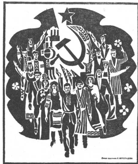
Das Glück der Sowjetvölker. «Literaturnaja gaset», Moskau

Die Ersetzung der Verfassung von 1936 wurde auf dem 21. Kongress der KPdSU im Januar 1959 beschlossen, d. h. angeordnet. In seiner grossen (und besonders langen) Kongressrede vom 27. Januar 1959 erklärte der damalige Parteichef und Ministerpräsident Chruschtschow u. a.: «Unter den gegenwärtigen Umständen ist unser Land in eine neue Phase seiner Entwicklung getreten. Die Notwendigkeit ist herangereift, in der Verfassung der UdSSR einige Aenderungen und Ergänzungen vorzunehmen... Im politischen und wirtschaftlichen Leben der Sowjetunion gibt es wichtige Aenderungen. Der Aufbau der kommunistischen Gesellschaft wurde zur unmittelbaren praktischen Aufgabe von Partei und Volk. Die gewaltigen Aenderungen im inneren Leben sowie in der internationalen Lage müssen sich auch im Grundgesetz unseres Staates widerspiegeln.» («Prawda», 28. Januar 1959)