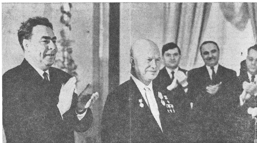
Der grosse Anreger der heutigen Verfassung war Chruschtschow. Als er 70 Jahre alt wurde, hatte ihm Breschnew am 17. April 1964 «neue Grosstaten für das Gedeihen unseres Vaterlandes» gewünscht. Im Herbst des gleichen Jahres stürzte er ihn und beanspruchte jetzt die Grosstaten selber. Er ist im Dezember 70 Jahre alt geworden.

Artikel 29 enthält nach der vorangegangenen Zielsetzung die Prinzipien der Aussenpolitik :