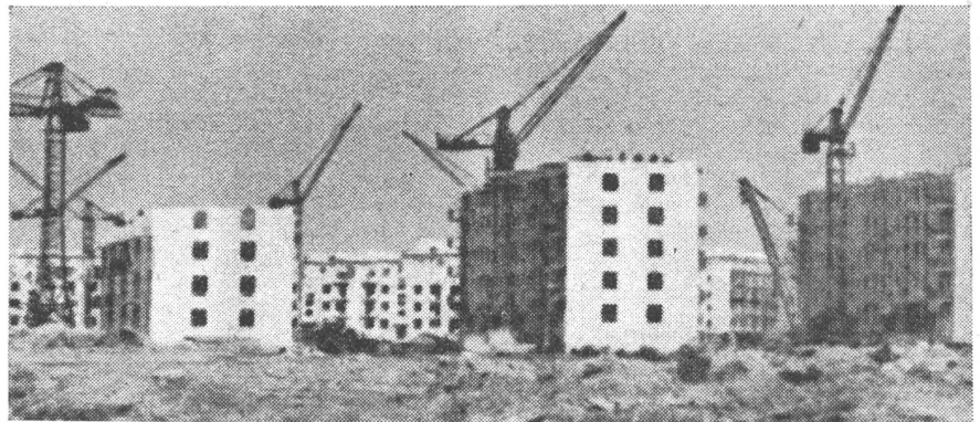
Das Recht auf Wohnung ist neu in die Verfassung aufgenommen worden. Die Wohnfläche pro Kopf beträgt heute 7 Quadratmeter im Durchschnitt. Neben dem Sozialismus gibt es also noch anderes zu bauen.