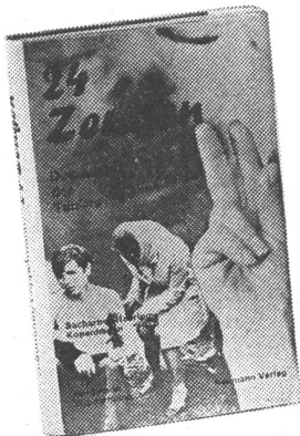
Zabelischensky: „Während die UdSSR sich damit brüstet, ein Inbegriff der Demokratie zu sein, ist sie in Wirklichkeit nichts anderes als ein riesiges Konzentrationslager.“

Breschnew hielt in seinem Referat ferner fest: «Es versteht sich von selbst, Genossen, dass der Verfassungsentwurf davon ausgeht, dass die Rechte und Freiheiten der Bürger nicht gegen unsere gesellschaftliche Ordnung, gegen die Interessen des Sowjetvolkes, ausgenützt werden können und dürfen.»