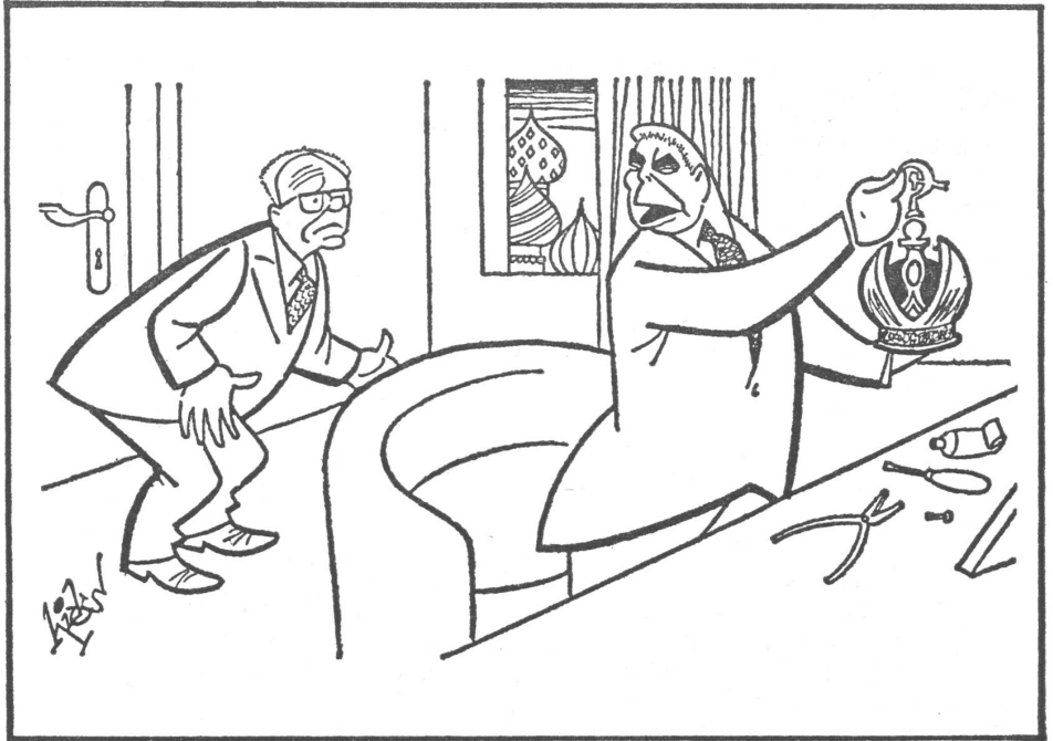
In Richtung zum Ziel: «Genosse Podgornyj, Sie können sich ruhig entfernen; ich bin eben daran, eine revolutionäre Idee zu verwirklichen.» («Magyar Hirado», Wien, 1. 6. 1977)

«Die Nutzung der Rechte und Freiheiten durch die Bürger darf den Interessen von Gesellschaft und Staat ... keinen Schaden zufügen.»