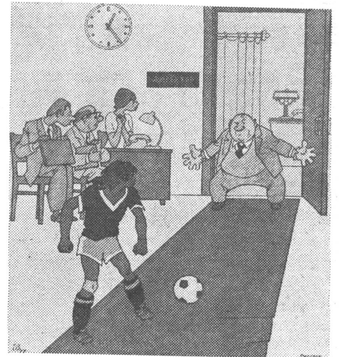
Der Direktor selektioniert seine Mitarbeiter.