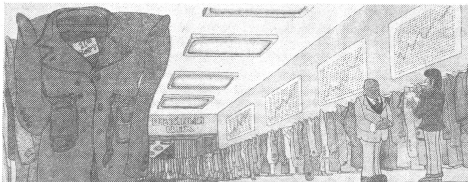
In der Konfektionsfabrik: «Wer kauft denn Ihre Ware?» (Sie ist laut Etikette auf der Jacke von der ersten Güteklasse.) «Nun, es gibt auf dem Lande immer noch ein paar Opas...»