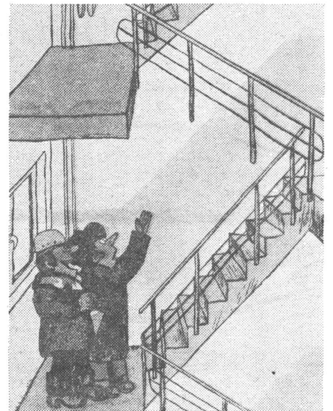
«Wie habt ihr das bloss geschafft, das Haus zu übergeben, wo doch eine ganze Treppe fehlt?» «Wir haben die Kommission eben im Lift befördert.»