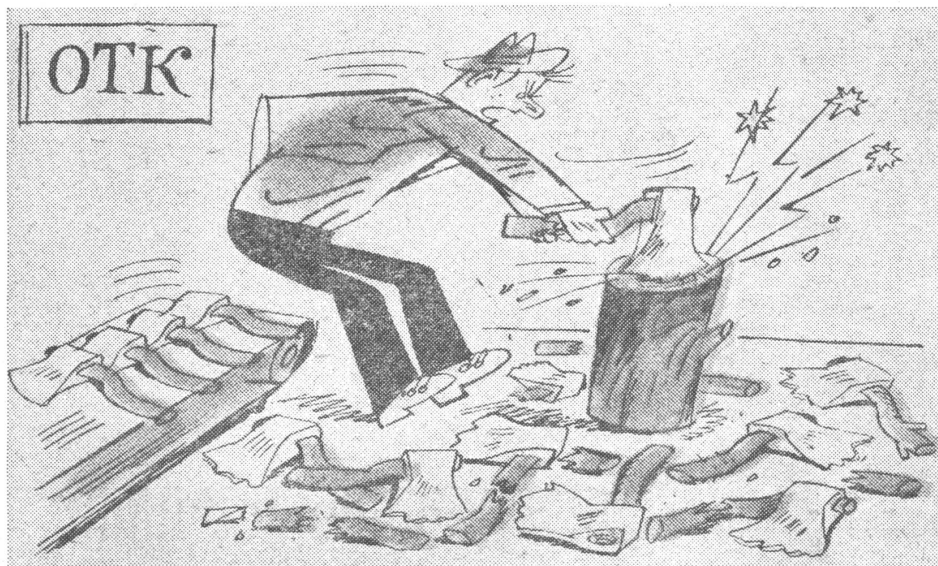
Ableitung für technische Kontrolle.