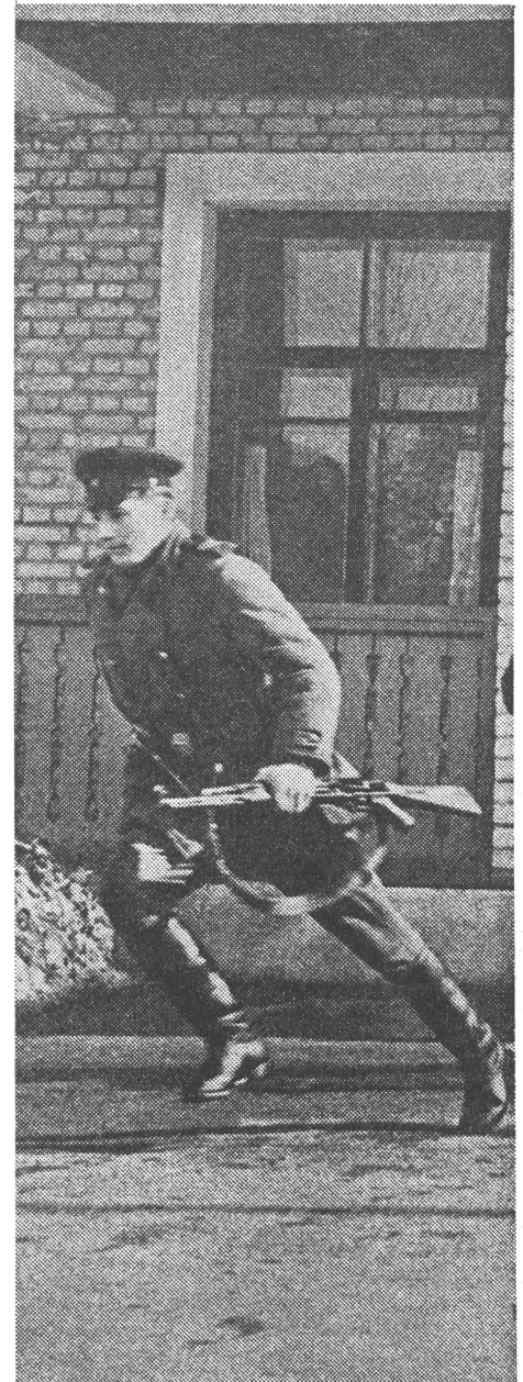
Alarmübung bei einer Unterkunft von Grenztruppen.