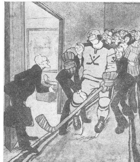
Und zu Ehren des neuen Eishockey-Weltmeisters die saisonale Hochschulglosse: «Das Semester hat begonnen.»