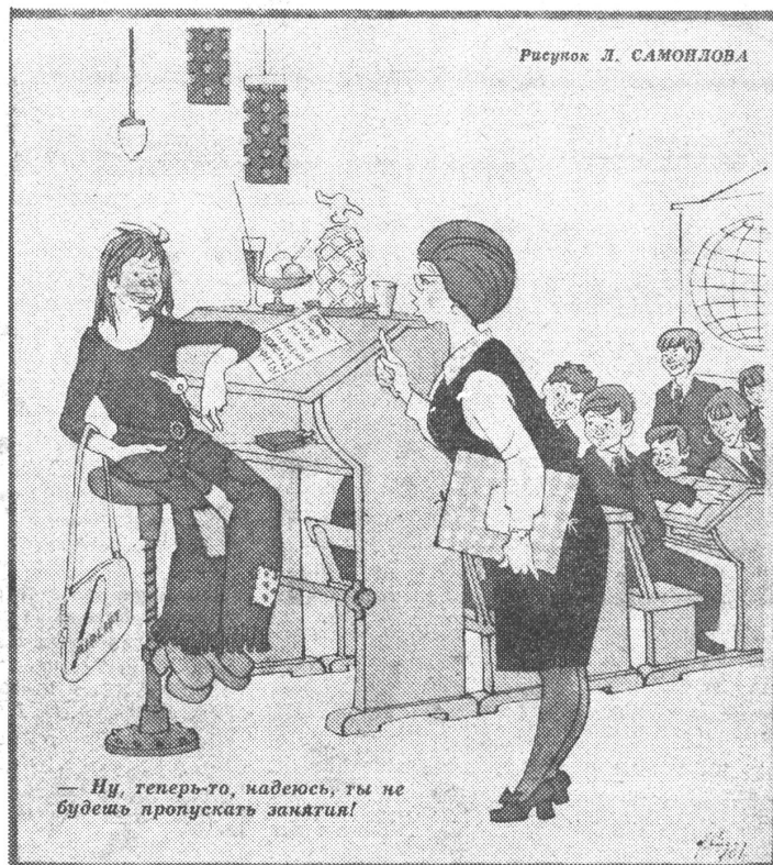
— Ну, теперь-то, надеюсь, ты не будешь пропускать занятия!