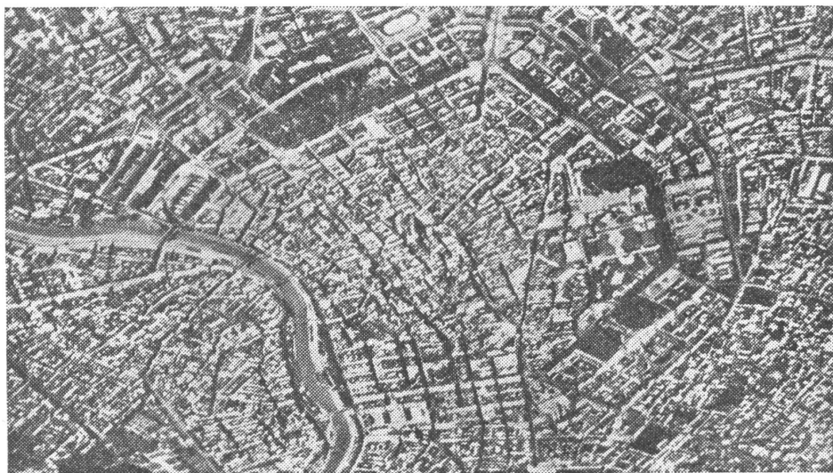
Wien. Laut Szanto ist es leicht, an die Stadt heranzukommen, aber schwer, sie einzunehmen — falls die Verteidigung in ihrem Innern organisiert würde.

besteht die Gefahr, dass die Armee als Ordnungsmacht der Reaktion unter der Parole der Aufrechterhaltung der Ordnung gegen das Volk eingesetzt werden kann.»