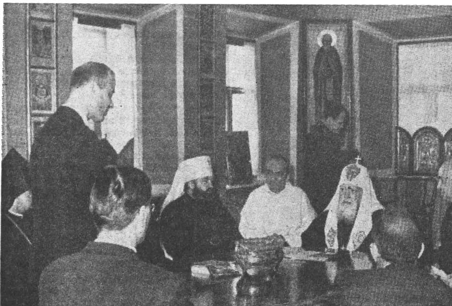
Kommissionssitzung des Weltkirchenrates in Sagorsk 1968. Vierter von links ist Nikodim.

Angesichts der in der ganzen Welt feststellbaren Ungerechtigkeiten können wir nicht neutral sein,