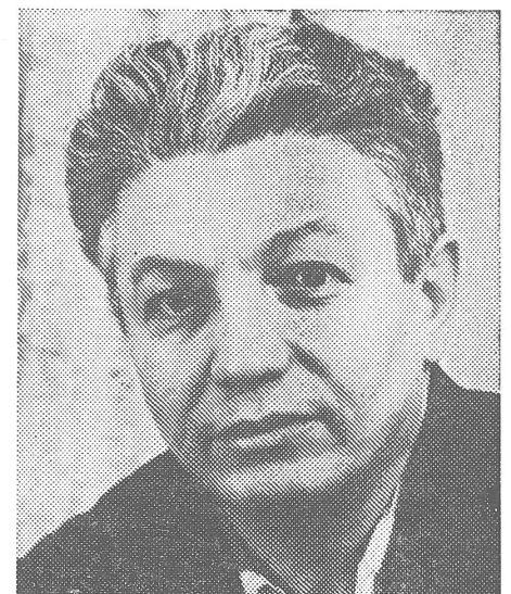
Wladimir Woinowitsch, Jahrgang 1932, diplomierter Schreiner und vom Berufsverband ausgeschlossener Schriftsteller, der ohnehin seit einigen Jahren seine Produktion in den Samisdat gibt. Auf diese Weise bekannt wurden insbesondere seine unsoldatischen Soldatengeschichten, nämlich «Die Abenteuer des Iwan Tschonkin» und die «Briefbekanntschaft» (siehe ZB, Nr. 23/1973).