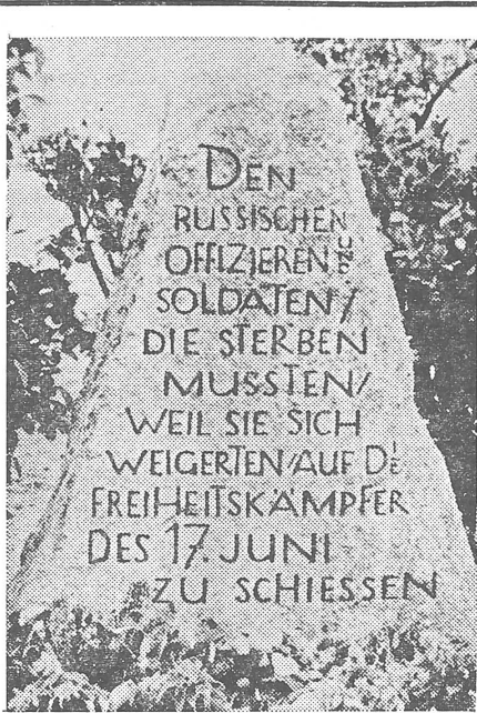
Gedenkstein in der Potsdamer Chaussee

am Autobahnverteiler «Kleeblatt» der Berliner AVUS