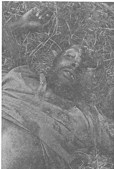
Von der Zipa entführter und erschossener Ausläufer.