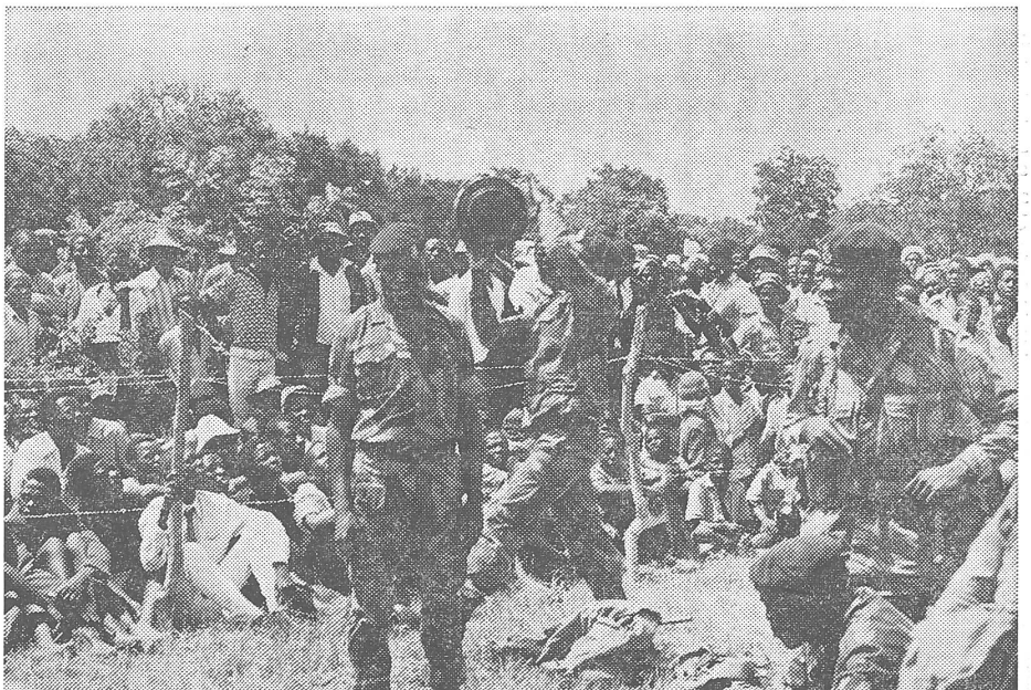
Instruktion auf dem Dorf. Die Mine, die der rhodesische Soldat hochhält, ist eine sowjetische TM. BA. III, die seit zwei Jahren in Afrika zum Einsatz gelangt.