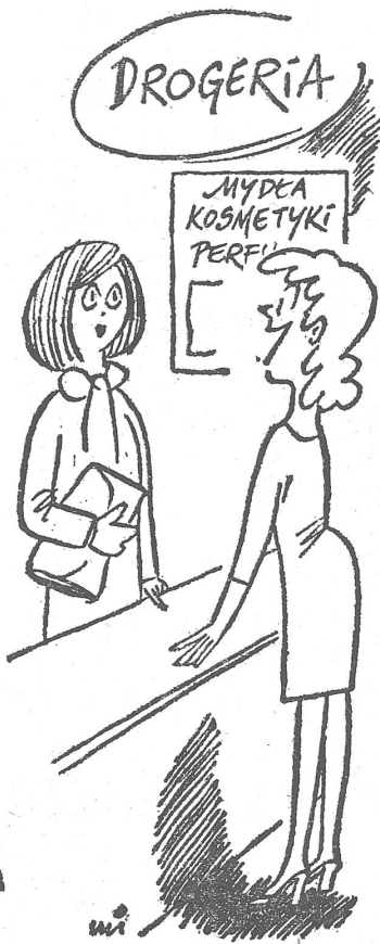
«Ich hätte gern ein Kilo Watte.» — «Aber goht sie nid dur d'Latte?» (21. 10. 1976)

Willkommener Zwang. Der Ehemann liest auf dem Plakat seiner Frau: «Von 17 bis 21 Uhr (d. h. in der Zeit, da die Frau nach der Berufsarbeit den Haushalt besorgt) verzichte ich auf Staubsaugen, Blochen, Bügeln. Stromersparnis!» (19. 10. 1976)