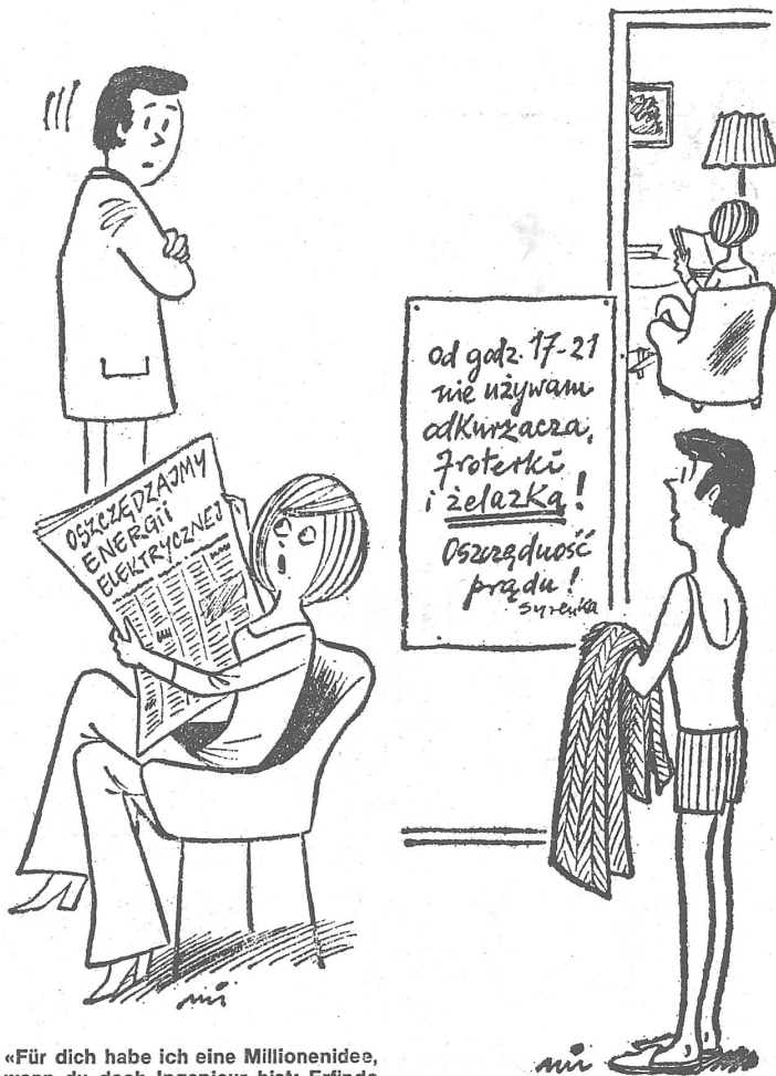
«Für dich habe ich eine Millionenidee, wenn du doch Ingenieur bist: Erfinde doch einfach eine Methode zur Wiedergewinnung von gebrauchtem Strom.» (20. 10. 1976)

Wie nehmen sich öffentliche Kampagnen, mit denen man die Bevölkerung zu besserem Verhalten in dieser oder jener Beziehung führen will, in Osteuropa aus? Als Beispiel kann die Aktion dienen, mit der die Warschauer Abendzeitung «Express Wieczorny» zum Stromsparen aufruft. Eine Reihe von belehrenden Beiträgen ist durch Karikaturen aufgelockert, die dem Leser das erforderliche Verhalten auch humoristisch nahelegen. Als Motto für das Ganze dient der täglich wiederholte Slogan «Kilowaty — nie na straty». Sein amtspoetisches Holpermass gibt uns das Alibi, ihn schlecht helvetisch mit dem Spruch «Kilowatte — nid dur d'Latte» wiederzugeben; sonst haben wir nichts gefunden, mit dem wir auch noch in der Bildlegende rechts das Wortspiel mit dem Kilo Watte reichlich wiedergeben könnten.