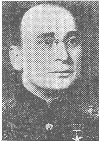
War Berija schon zu Lebzeiten Stalins verschworener Gegenspieler?

Die Leibärzte Stalins waren rechtzeitig ausgeschaltet worden, und erst mit grosser Verzögerung besuchten Aerzte, die unbekannt waren, den Diktator, der einen Schlaganfall erlitten hatte, und nochmals andere Doktoren erstellten