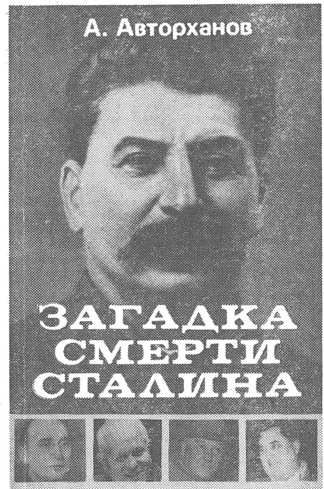
Das Buch von Awtorchanow

Nicht von ungefähr hiess Berija auch «der bolschewistische Fouché». Er tat sich bereits 1918/19 in «geheimer Parteiarbeit» in Baku hervor, als er aber tatsächlich «eine schwindelnde Polizeikarriere gleichzeitig in vier Aufklärungsdiensten machte — im sowjetischen, im [nationalistisch-aserbeidschanischen] Mussawat, im türkischen