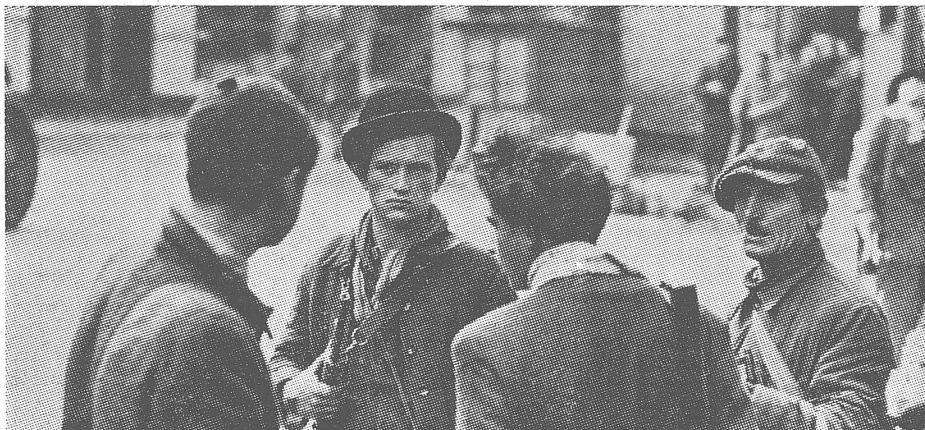
Nach dem Sieg über die Besatzer in Erwartung der Invasoren.

Trotz der ungünstigen Ausgangslage wurde der Kampf in Ungarn nicht so schnell eingestellt. Bis zum 7. November kämpfte die Nationalgarde (und in ihren Reihen zahlreiche Soldaten und Offiziere) gegen die sowjetische Uebermacht. Ungarische Flak-Geschütze schossen in dieser Zeit allein über Budapest drei sowjetische Flugzeuge ab. In der Provinz dauerten die Kämpfe bis zum 15. November an; dann kapitulierte die erste «sozialistische Stadt Ungarns», Szatalinvaros (heute Dunaujvaros). Die Sowjets hatten gesiegt.