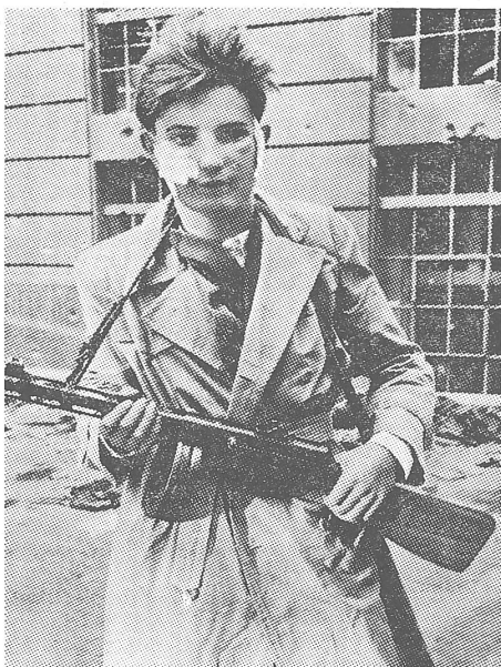
Nach dem Sturm auf das Radiogebäude: Ein «Konterrévolutionär», der bestimmt nicht vom «Ancien régime» erzogen worden war. Der Aufstand zeigte, dass die angebliche Macht der Werktätigen und des Fortschritts die Arbeiterschaft und die Jugend des Landes gegen sich hatte.

oder versuchten, sich den abziehenden Sowjets anzuschließen. Nur sehr wenige Offiziere wurden von den Sowjets am 3. November über die kommenden Ereignisse informiert.