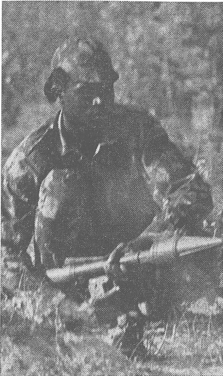
Sowjetische Bewaffnung (hier Rakrohr) und sowjetabhängige kubanische Truppen hatten in Angola der MPLA zum Sieg über die beiden andern Befreiungsbewegungen FNLA und UNITA verholfen. Sollte westliche Diplomatie die weitere Anwendung des erfolgreichen Rezeptes verhindern können?

Sithole nach Tansania. Zuvor war aber Sithole als ANC-Chef von Robert Mugabe (51) abgesetzt worden. Bis 1963 war Mugabe noch Zappu-Generalsekretär gewesen. Heute residiert Mugabe in Moputo (früher Lourenço Marques) und kommandiert die «Zimbabwe Volksarmee» (Zi-pa).