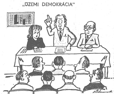
Betriebsdemokratie: «Wir schreiten zur Abstimmung. Befürworter und Gegner meines Antrags erheben jetzt die Hand zum Zeichen der Annahme.»

Aber die Auswahl unten hat einen Adressaten, den man normalerweise lieber nicht anrempelt (was die Karikaturisten denn auch kund tun). Dem Innenministerium unterstehen Polizei und Sicherheitsdienst. Und die ominöse Frage, wieviel man für eine Karikatur kriegen kann, zählte man bis anhin zu den Flüsterwitzen.