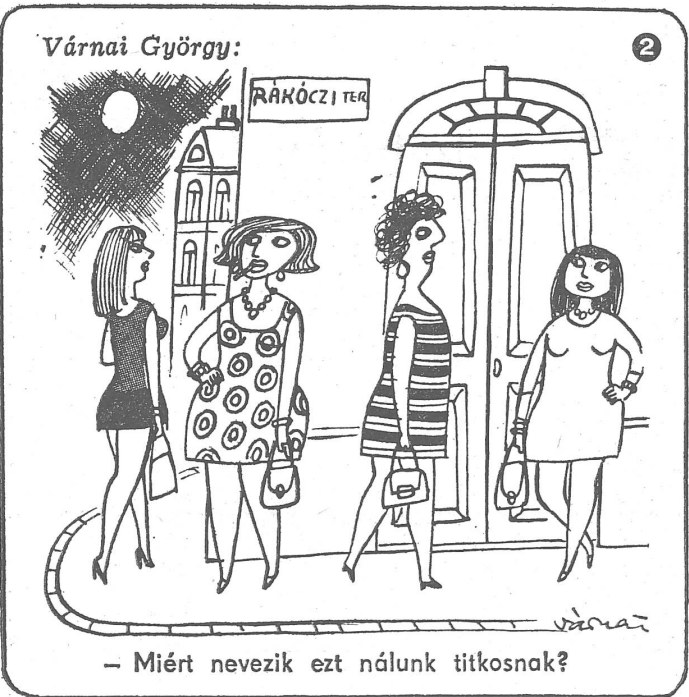
– Miért nevezik ezt nálunk titkosnak?