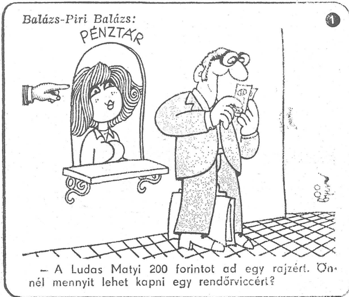
– A Ludas Matyi 200 forintot ad egy rajzért. Ön-nél mennyit lehet kapni egy rendőrviccért?