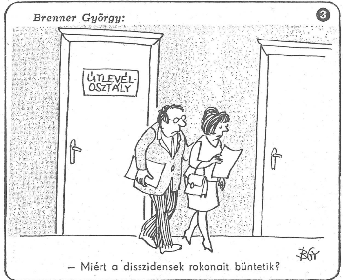
– Miért a disszidensek rokonait büntetik?