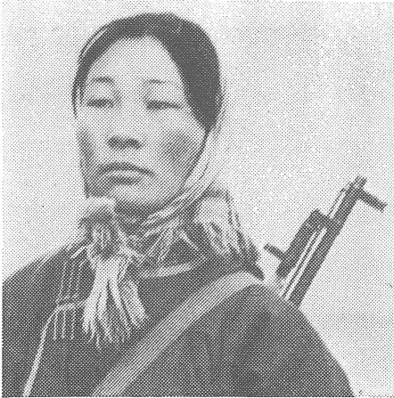
... und Wachsamkeit in der Innern Mongolei.

Teil der Sowjetunion auszuteilen. Chinas Atomforscher brauchten für den Sprung von der Kernspaltung zur Kernfusion nur drei Jahre. Die Amerikaner benötigten dafür sieben, die Russen vier Jahre. Den gleichen Weg scheinen die Chinesen beim Bau von interkontinentalen Träger raketen zu gehen. Während Amerikaner und Sowjets jahrelang mit Flüssigsauerstoff als Antriebskraft experimentierten, entschieden sich die Chinesen offenbar gleich für lagerbare und selbstzündende Treibstoffe.