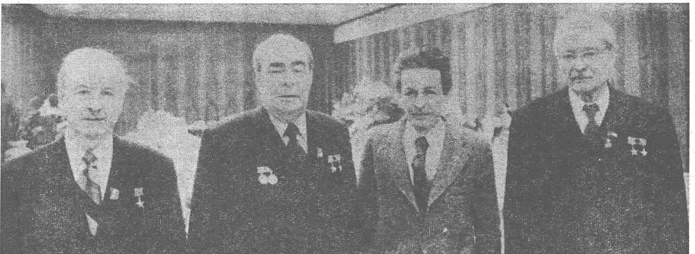
KP-Chef Berlinguer beim 25. KpdSU-Kongress in Moskau zusammen mit Breschnew, Ponomarow (links aussen) und Suslow (rechts aussen). Dort begründete er die Proklamierung seines eigenen Weges zum Sozialismus mit dem Einfluss, den seine Partei damit gewonnen habe. Aber selbst abgesehen davon: Wie weit entspricht der «eigene Weg» auch einem eigenen Ziel?