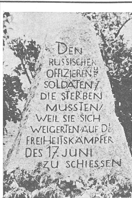
Gedenkstein in der Potsdamer Chaussee

am Autobahnverteiler «Kleeblatt» der Berliner AVUS