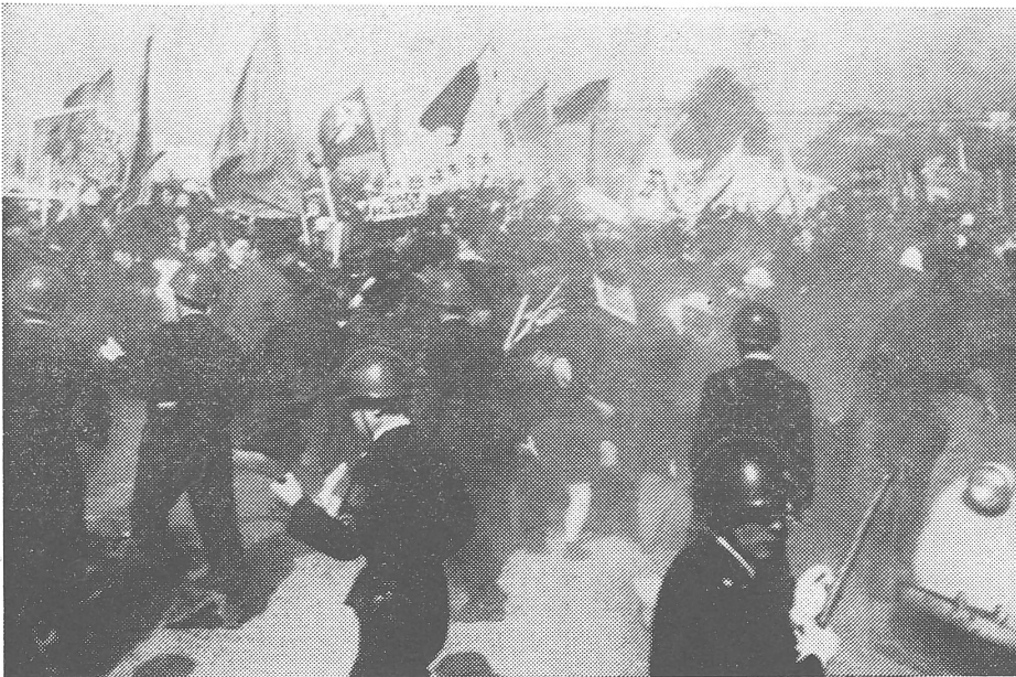
So «entradikalisiert», wie sie sich in wohlabgewogenen Erklärungen gibt, ist die Kommunistische Partei Japans nun auch wieder nicht, wenn es zum Beispiel darum geht, ihre Macht auf der Strasse zu zeigen.

Diese antigouvernementale und antiamerikanische Demonstration vom 1. Mai 1972 sollte als «blutige Maifeier» eine Serie von Gewaltanwendungen einleiten. Den Kommunisten, die hier mitmachten, musste es in jenem Zusammenhang darum gehen, sich nicht von der Militanz der Linksozialisten und der «neulinken» Gruppen wie die Sehigun-Ha (Rote Armee Fraktion...) in den Schatten stellen zu lassen. Gegen die Verlängerung des Sicherheitsabkommens mit den USA wurde das Land damals in regelrechten Aufruhr versetzt.