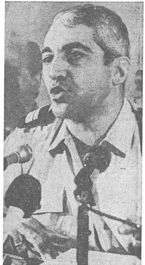
Der Ex-General als Präsident in spe: Carvalho bei der Bekanntgabe seiner Kandidatur.