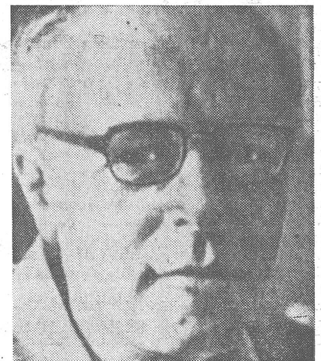
Andrej Sacharow: Solidarität womit?

Wobei es offenkundig ist, dass diese Unterstellung im Interesse der sowjetischen Dissidenten liegt. Man nennt sie Verbündete des ausländi-