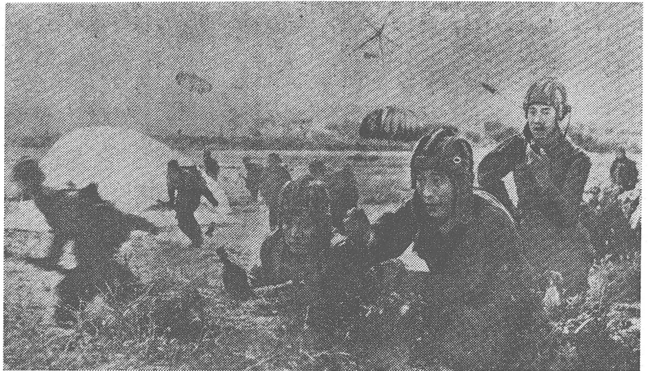
«Erzogen im Geiste des Antisowjetismus: Luftlandtruppen der chinesischen Armee.»