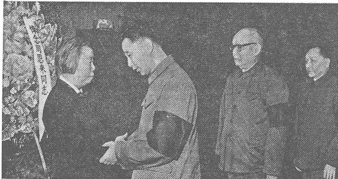
Teng Hsiao-ping (rechts aussen) auf Kondolenzbesuch bei der Witwe von Tschu En-lai. Sein Sturz bald danach hat Macht- und Richtungskämpfe sichtbar werden lassen. Angesichts von Führungsschwächen und bevorstehender Vakanz an der obersten Spitze können sie zu Auflösungserscheinungen führen, die man in einem Interregnum nicht mehr leicht auffangen kann.

Indessen zeitigte die verproletarisierte Bildungspolitik vernichtende Folgen, namentlich in der Produktion. Als die Pragmatiker um 1970 wiederum die Kontrolle übernahmen, versuchten sie, die Bildungspolitik vorsichtig zu modifizieren. Die höheren Schulen und Universitäten wurden wiederum geöffnet. Und nun fallen den seither ausgebildeten Studenten alle guten Stellen zu, derweil die Jugendlichen, die sich bloss «revolutionäre Erfahrungen» zulegen konnten, das Nachsehen haben. Das hat verständlicherweise Unzufriedenheit geweckt. Als Mitte 1975 die