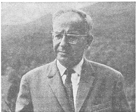
Gustav Husak, Kollaborateur des Faschismus in allen seinen Formen.