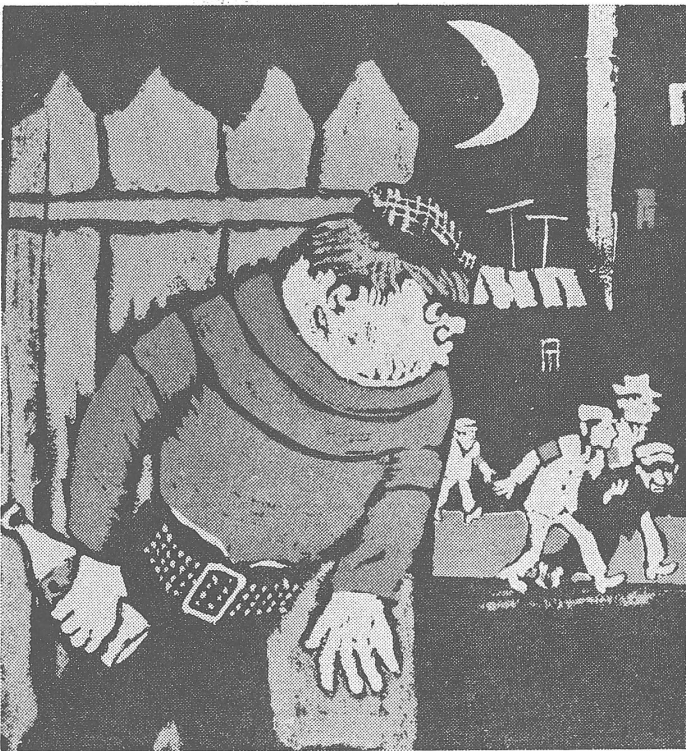
Oben: «Nicht einmal aus seiner eigenen Wohnung kann man gehen» (weil die Milizen die Betrunkenen abführen).