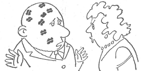
«Die Mitarbeiterinnen unserer Abteilung haben halt den 8. März gefeiert.»

Endlich schliefen die Kinder ein, und auch die Frau gab mehr oder weniger Ruhe. Ich wusch das Nacht-