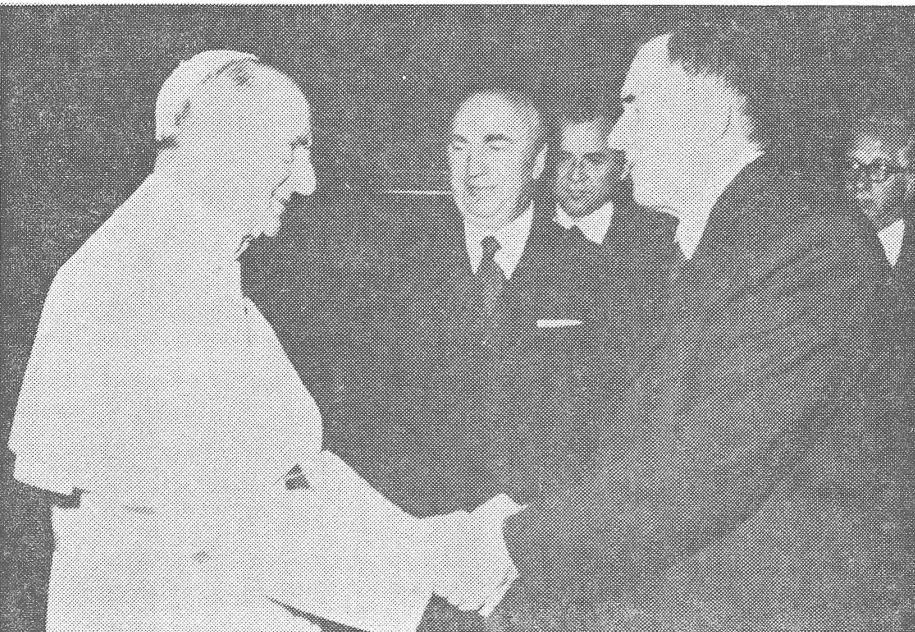
... zur Servilität (Paul VI. empfängt Gromyko).