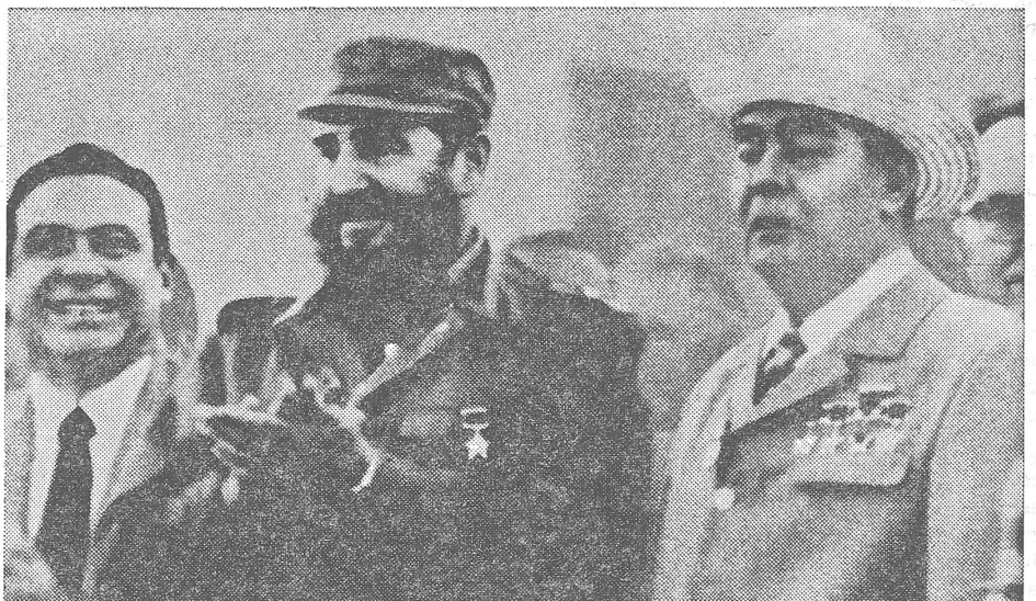
Breschnew bei Castro. Die Satellisierung Kubas, das sich 1963 von Moskau distanziert hatte, durch die Sowjetunion begann 1968. Heute ist sie, wie die Kongressdokumente beweisen, restlos durchgeführt.

Kuba hat heute diplomatische Beziehungen zu 95 Ländern — darunter zu 11 lateinamerikanischen und karibischen Ländern — und sieht seine wichtigste aussenpolitische Funktion in der Förderung der marxistisch-leninistischen — d. h. der Moskauer — Revolution in der Dritten Welt, da es selbst zu dieser Welt gehört. Aus diesem Grunde hat es viel vorteilhaftere Bedingungen als die europäischen Satelliten Moskaus oder Moskau selbst, im erwähnten Raum den Kampf gegen den chinesischen Einfluss aufzunehmen. ■