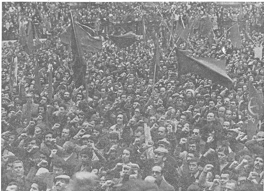
PKP-Demonstration in Lissabon. Das sind «die Massen des Volkes», auf die sich die Parteführung zuverlässig beruft. Aber sie vertreten trotzdem nur ein Achtel der Wahlberechtigten.