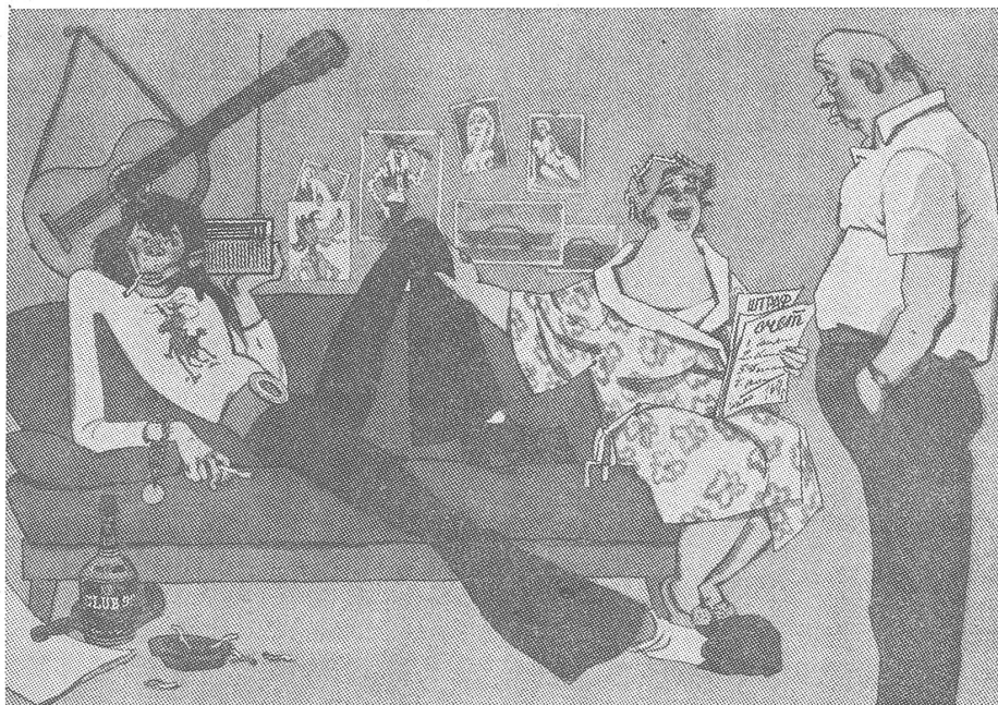
«Allmählich musst du dich halt noch nach einem Nebenverdienst umsehen. Der Kleine ist doch recht gross geworden; da sind seine Bedürfnisse eben gewachsen.» So spricht zum Vater die Mutter, die in der Hand eine Rechnung und einen Bussenzettel hält, die Zeichen der emanzipierten Lebensweise des Sprösslings.

Nebenbei kommt hier die völlig normale Tatsache zum Ausdruck, dass man auch in der Sowjetunion Altpapier sammelt, obwohl das Thema an polnischen Schulen offenbar als Peinlichkeit empfunden wird. Siehe in ZB, Nr. 22/1975 dazu das Interview mit einem polnischen Mittelschüler aus der Warschauer Zeitung «Polityka». Die Lehrerin hätte also die unbefangene Frage des Jungen in aller Selbstverständlichkeit mit einem Ja beantworten können, statt in heillosen Verlegenheit das Thema zu wechseln. Nur werden Fragen über den grossen Nachbarn eben nie als harmlos empfunden, wenn sie in Abweichung zum gedruckten Lehrgang gestellt werden.