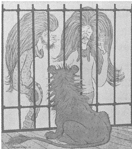
Neid im Löwenherz: «Wenn nur unsereiner auch so eine Mähne hätte...»

Das hätte auch auf der Humorseite einer (etwas bourgeoisen) westlichen Zeitung erscheinen können – so vor ein paar Jahren. Allerdings: Im Militärdienst, in Erziehungsanstalten usw. ist in der UdSSR das kurzgeschnittene, respektive kurz geschorene Haar ein Obligatorium an dem nicht gerüttelt werden darf.