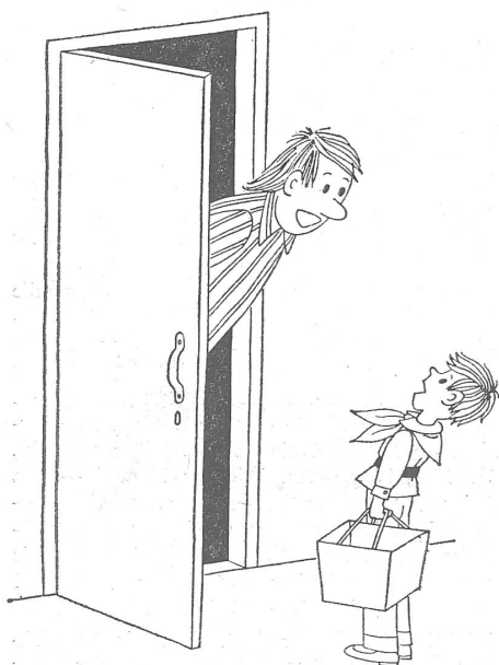
«Haben Sie Altpapier?» – «Nein, wir haben Fernsehen.»

Ein hübscher Bescheid, der übrigens über alle Systemgrenzen hinweg einleuchtet.