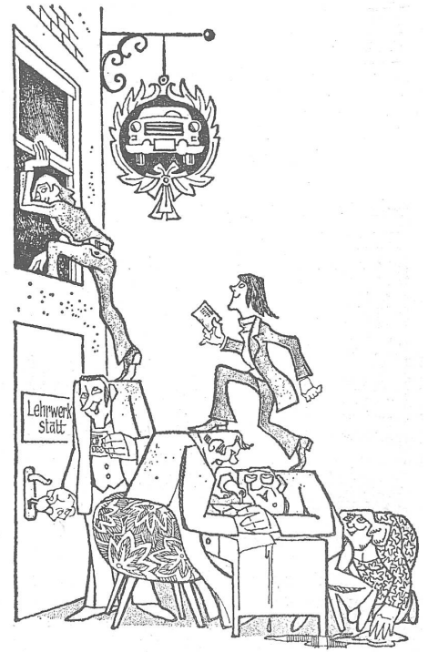
«Ihnen brauch ich wohl nicht viel zu erzählen. Sie werden selbst die Stellen finden, die umgedeckt werden müssen!» (Nr. 38/1975)

Während der offiziellen Arbeitszeit zu 2.50 Mark Stundenlohn bummeln die Bauarbeiter, aber dafür sind sie nach Feierabend als Schwarzarbeiter für private Aufträge zu haben, denn z. B. für Reparaturen kann man bei den staatlichen Unternehmungen eine Ewigkeit anstehen. Die 20 Mark sind satirisch übertrieben, aber 10 Mark liegen ohne weiteres drin.