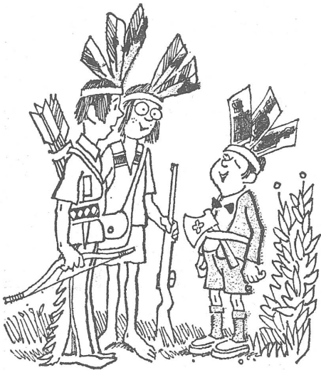
«Darf ich nun mitspielen?» (Nr. 38/1975)

Die zwinkernde Frage zeigt, dass die altklugen Kinderchen in Sachen Bestechung schon Bescheid wissen. «Früh krümmt sich...?» Aber nein, wir haben es doch unterdessen besser gelernt: Der Mensch ist ein Produkt seiner (gesellschaftlichen) Umgebung.