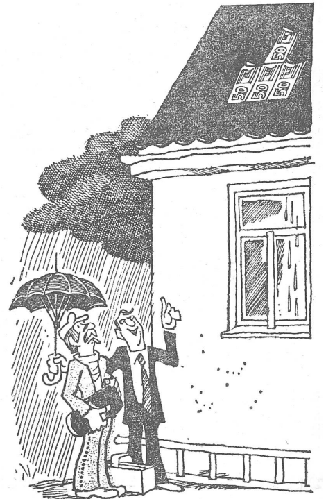
Mit Vitamin B zur guten Ausbildung: «Die guten Lehrstellen sind zwar schon besetzt, aber den Kindern guter Bekannter werden wir den beruflichen Aufstieg nicht versauen.» (Nr. 29/1975)

Die Dienstleistungsbetriebe arbeiten zu garantierten Fixpreisen. Aber damit sie arbeiten, braucht es noch ein paar vertraulich zugesteckte Scheine.