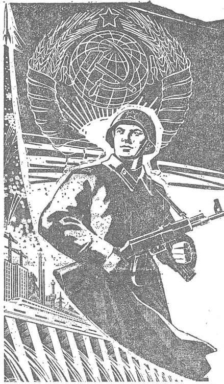
Die «flankierende Massnahme» der Koexistenzpolitik ist der militärische Ausbau zwecks Ueberlegenheit des Friedenslagers. Wohl nirgends in Europa ist das soldatische Heldenbild so unversehrt wie in der Sowjetunion.

Mit anderen Worten: Die friedliche Koexistenz garantiert dem Osten unter völkerrechtlicher Verankerung der Prinzipien dieser Politik eine legale ideologische Aggression (nach dem sowjet-eigenen Terminus technicus).