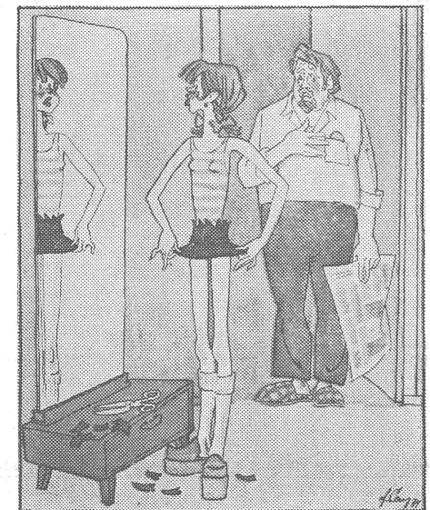
Das maximale Mini: «Du, Papa, mir jedenfalls passt dein neuer Hut.» (Nr. 25/1974)