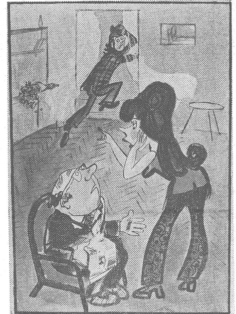
«Was hast du denn zu meinem Bräutigam gesagt?» – «Nun, dass ich pensioniert werde.» (Nr. 30/1974)