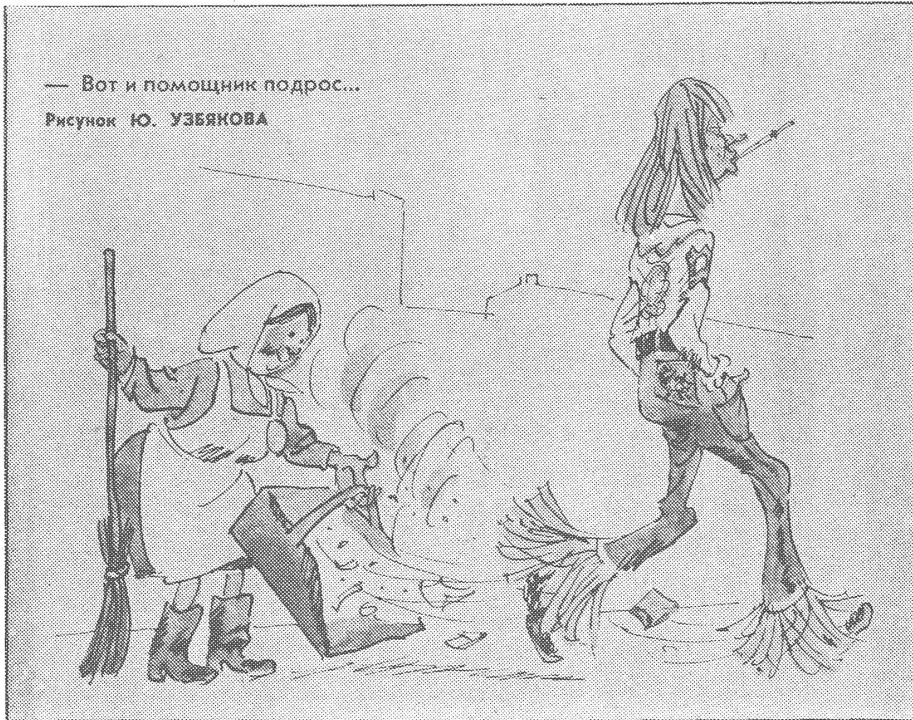
— Вот и помощник подрос... Рисунок Ю. УЗБЕКОВА