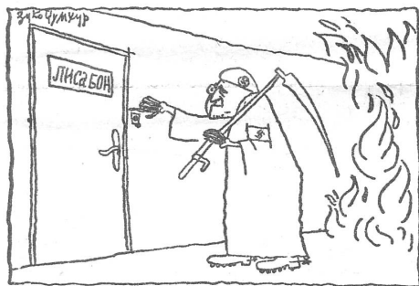
Spinola (an der Türe zu Lissabon pochend) ante portas. («Politika», Belgrad, 17. 8. 1975)

Ich nehme an, dass Ihre Frage rhetorisch gemeint ist. Aber es schadet nicht, sich den Ablauf dieser kommunistischen Partnerbehandlung wieder in Erinnerung zu rufen. Nach dem Coup d'Etat vom 14. April 1974 hatten sowohl die portugiesischen als auch die ausländischen Kommunisten die von ihnen als solche anerkannte Revolution der Militärs unter Spinola begeistert begrüßt. Ihre damalige Forderung an die «verbündeten Kräfte» lautete damals bloss «nicht ohne uns», und Spinola kam ihr nach. Als er aber im September letzten Jahres deutlich machte, dass er die Abschaffung der alten Diktatur nicht als Vorbereitung zu einer neuen Diktatur verstanden haben wollte, machten die unter seinen Fittichen grossgewordenen KP-Kräfte in ihrer zivilen und militärischen Gestalt Front gegen ihn und erzwan-