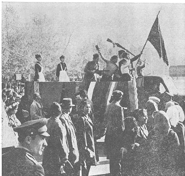
Kinder auf Militärfahrzeug beim Umzug vom (7.) November in Taschkent. Diese Militarisierung von Jugend und Gesellschaft wird bedingungslos gutgeheissen von Organisationen wie dem Weltfriedensrat, der damit keineswegs an die Parole der Gewaltlosigkeit glaubt, sondern sie bewusst missbraucht.

Die Aggressionskontrolle muss in einer abendländischen individualistischen Gesellschaft anders vor sich gehen als in einer kollektiven Gesellschaft. Die letztere kann unbequeme Aktivitäten ohne weiteres unterdrücken; sie bezahlt dies mit unnötiger Passivität und langsamer Entwicklung.