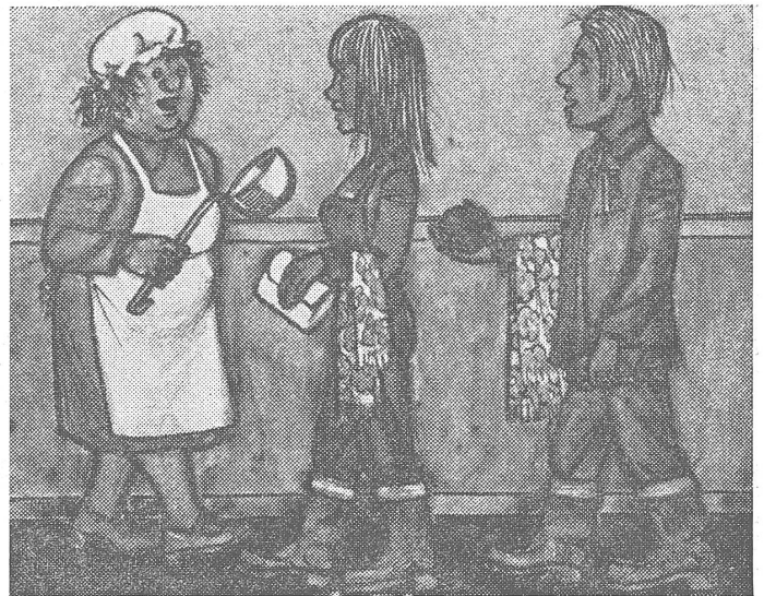
«Wie geht denn das, mit nur einer Waschanlage?» «Nacheinander. Wir waschen zuerst die Gummistiefel und dann uns.»