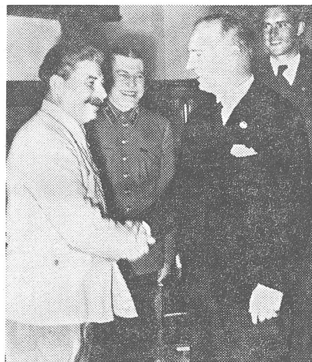
Der Pakt vom August 1939 stellte die Ausgangslage zum Weltkrieg her, der zwei Wochen später begann. Links: Molotow unterzeichnet. Rechts: Stalin beglückwünscht Ribbentrop zum Vertragsabschluss. Die Verbündeten teilten sich Polen.