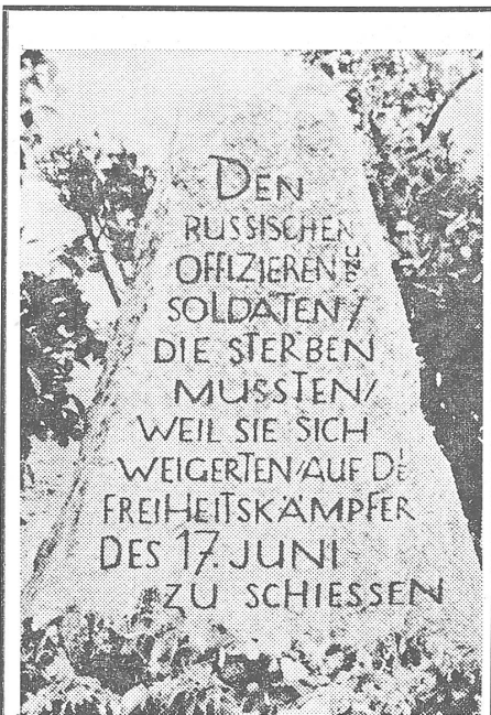
Gedenkstein in der Potsdamer Chaussee

am Autobahnverteiler «Kleeblatt» der Berliner AVUS