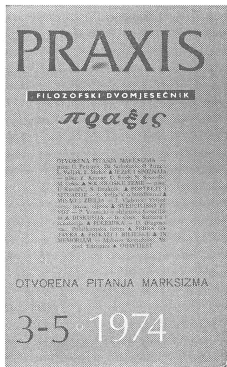
Die letzte Nummer ...

«Praxis» war ein Experiment, das elf Jahre gedauert hat. Sie bildete ein internationales Forum für Marxisme, die sich einem «Sozialismus mit menschlichem Gesicht» verschrieben hatten.