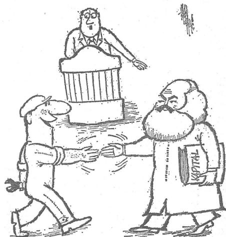
Alte Bekannte. («Oslobodenje», 18. 1. 1975.) Der Arbeiter braucht keinen Dozenten als Vermittler zu Marx (!?).