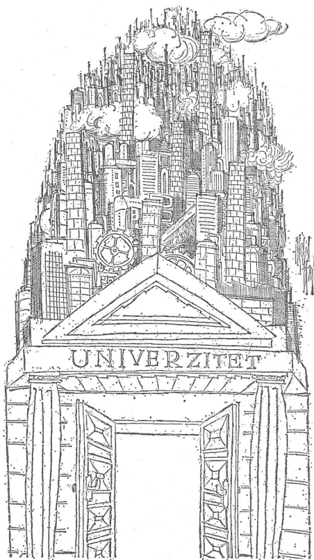
Ueberbau. («Oslobodenje», 8. 2. 1975.) Und da meint man bei uns, das Thema «Universität im Dienste der Wirtschaft» stelle sich nur im Westen ...