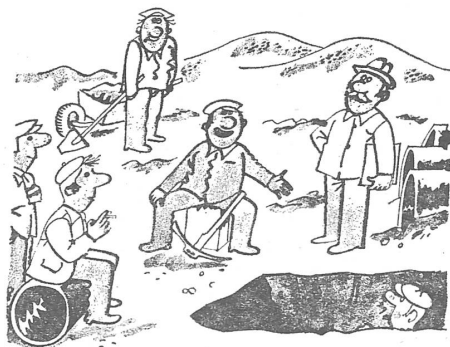
«Heute ist der IF (Internationaler Tag der Frau) und so, Herr Meister, unterhalten wir uns über die Frauen.» («Dikobraz», Nr. 10/1974)

«In der Sowjetunion wurden günstige Voraussetzungen für die Festigung und das Gedeihen der Familie geschaffen. ... Der sowjetischen