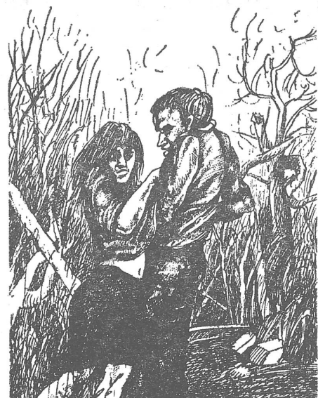
Text über Bild: «Studentinnenmütter erhalten zusätzliche Stipendien.» Text unter Bild: «Hab doch keine Angst, bekommst doch mehr Stipendium.» («Szpilki», Nr. 40/1974)

Frau werden die notwendigen sozialen und Lebensbedingungen für eine Verbindung glücklicher Mutterschaft mit einer immer aktiver werdenden und schöpferischen Teilnahme an der Produktion und am soziopolitischen Leben garantiert.