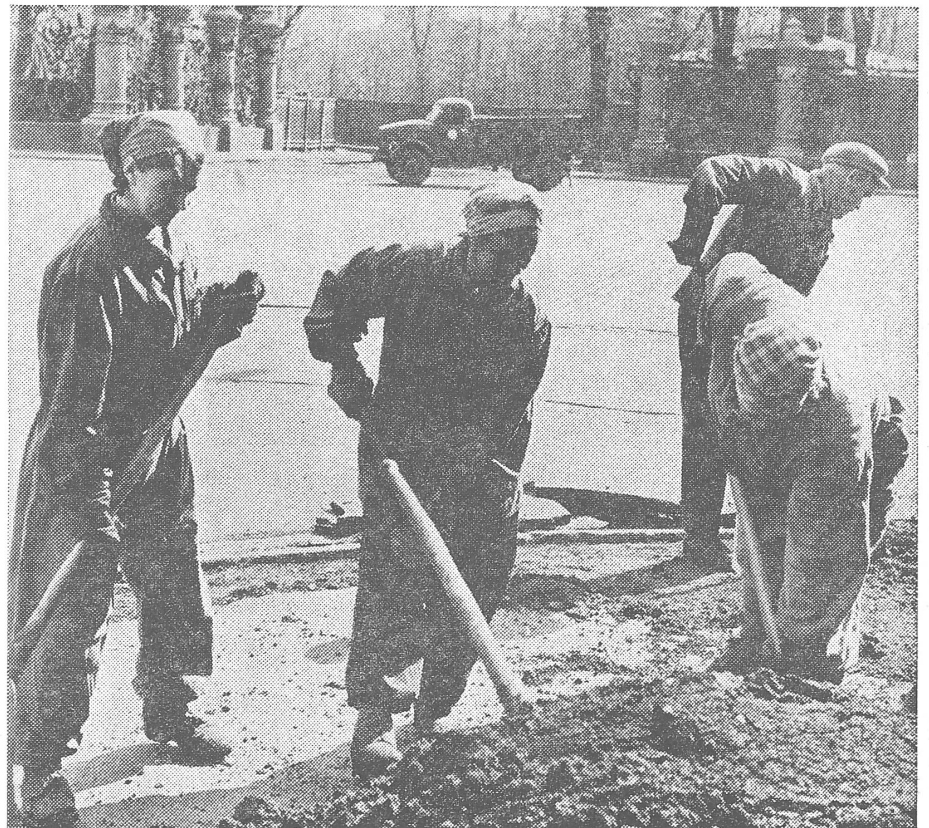
Frauentrupp bei Schwerarbeit, in der Sowjetunion ein alltäglicher Anblick.