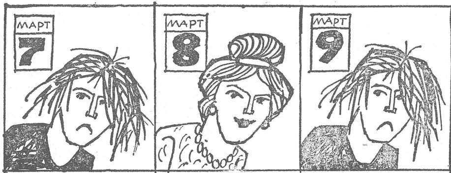
Ohne Worte: 7. März, 8. März, 9. März ...

Aehnliche Probleme ergeben sich in den Volkswirtschaften. In Polen erreicht der Anteil der weiblichen Arbeitskräfte in der Volkswirtschaft 40 %, im Gesundheitswesen sogar 75 %, im Handel 65 %, in den Versicherungs- und Finanzbranchen 70 % usw. Unter den leitenden Funktionären findet man aber nur ausnahmsweise Frauen. Die gesamte Partei- und Staatsführung besteht aus lauter Männern, und in der Industrie stellt das zarte Geschlecht ganze 2 % der Gene-