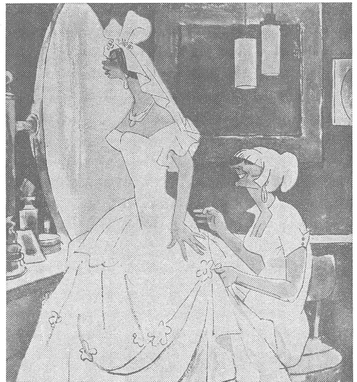
«Ja, mein Liebes, das Kleid ist solide genäht. In dem können Sie noch ein paarmal Hochzeit feiern.» (Nr. 15/1974)