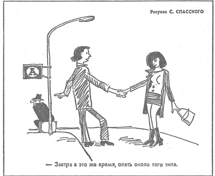
— Завтра в это же время, опять около того типа.