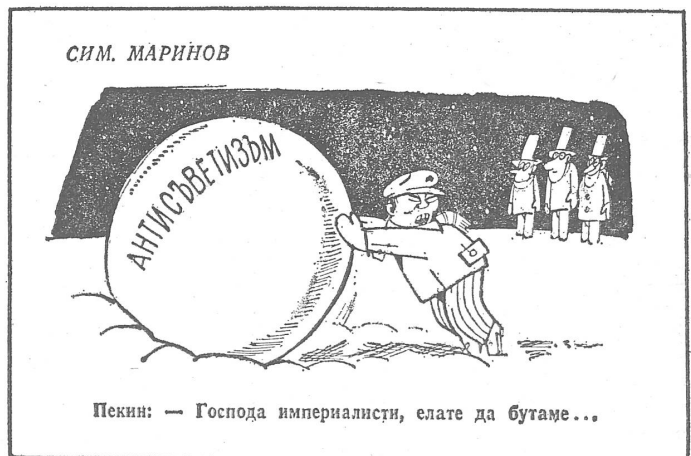
Schneeball des Antisowjetismus. Peking ruft: «Helft mit, ihr Herren Imperialisten!» («Narodna Armija», Sofia, 16. 1. 1975)