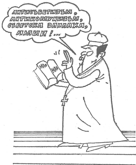
«Asiatischer Prediger» mit Mao-Bibel: «Antisowjetismus, Antikommunismus... Amen.» («Narodna Armija», Sofia, 22. 1. 1975)

Diese jugoslawische Karikatur ist ausgesprochen neutral gehalten, was man von den bulgarischen Zeichnungen auf dieser Seite gewiss nicht behaupten kann.