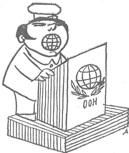
China vor der UNO: ein Mundvoll Erde. («Rabotničesko Delo», Sofia, 1. 1. 1975)