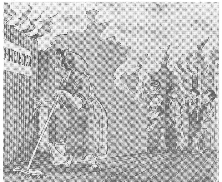
Der Rauch aus dem Lehrerzimmer: «Also unsere Lehrer – rein wie die Kinder!» (Nr. 29/1974)