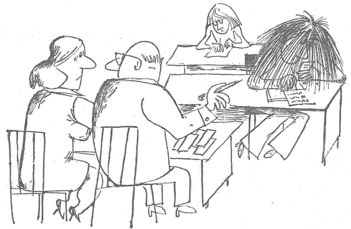
«Mir scheint, jener Abiturient dort braucht einen Spickzettel.» (Nr. 22/1974)