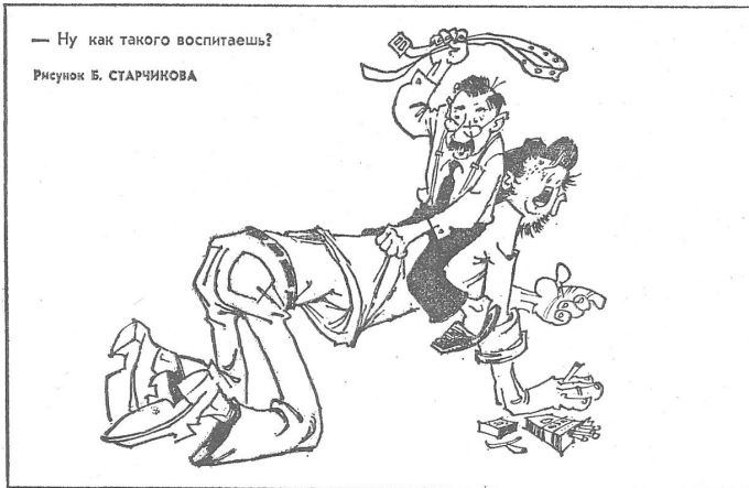
«Wie willst du denn so einen erziehen?» (Die gute alte Sitte besteht darin, den Sprössling zwischen die Beine zu klemmen, um ihm die väterlichen Hiebe zu verabreichen.) (Nr. 23/1974)